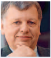
Direktor Wolfgang Kos, Wien Museum

» Wenn es um die Habsburger geht, denkt man automatisch an Schönbrunn – und im ersten Moment wohl kaum an das Wien Museum. Die Website www.habsburger.net bietet für uns daher die Chance, im Zusammenhang mit den Habsburgern auf unser Haus aufmerksam zu machen. Und nicht zuletzt können dort manche Objekte zumindest virtuell gezeigt werden, die bei uns aus Platzgründen im Depot lagern.“