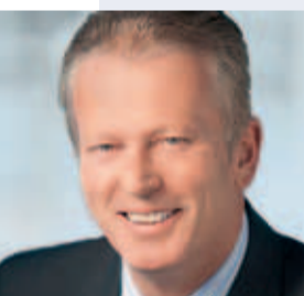
Dr. Reinhold Mitterlehner Bundesminister für Wirtschaft, Familie und Jugend

Die über 630 Jahre währende Herrschaft der Habsburger hinterlässt bis heute unzählige kulturelle Spuren. Das reiche historische Erbe macht Österreich zu einer erfolgreichen Destination für Kulturinteressierte aus aller Welt. Um diese Position zu stärken, zählt der Bereich Städte & Kultur in der neuen Tourismusstrategie gemeinsam mit den Alpen sowie Donau & Seen zu einem der drei Alleinstellungsmerkmale Österreichs, auf die wir uns im Marketing verstärkt konzentrieren. Wir setzen damit auf attraktive, unverrückbare Werte, die keinen kurzfristigen Modeerscheinungen zum Opfer fallen können.